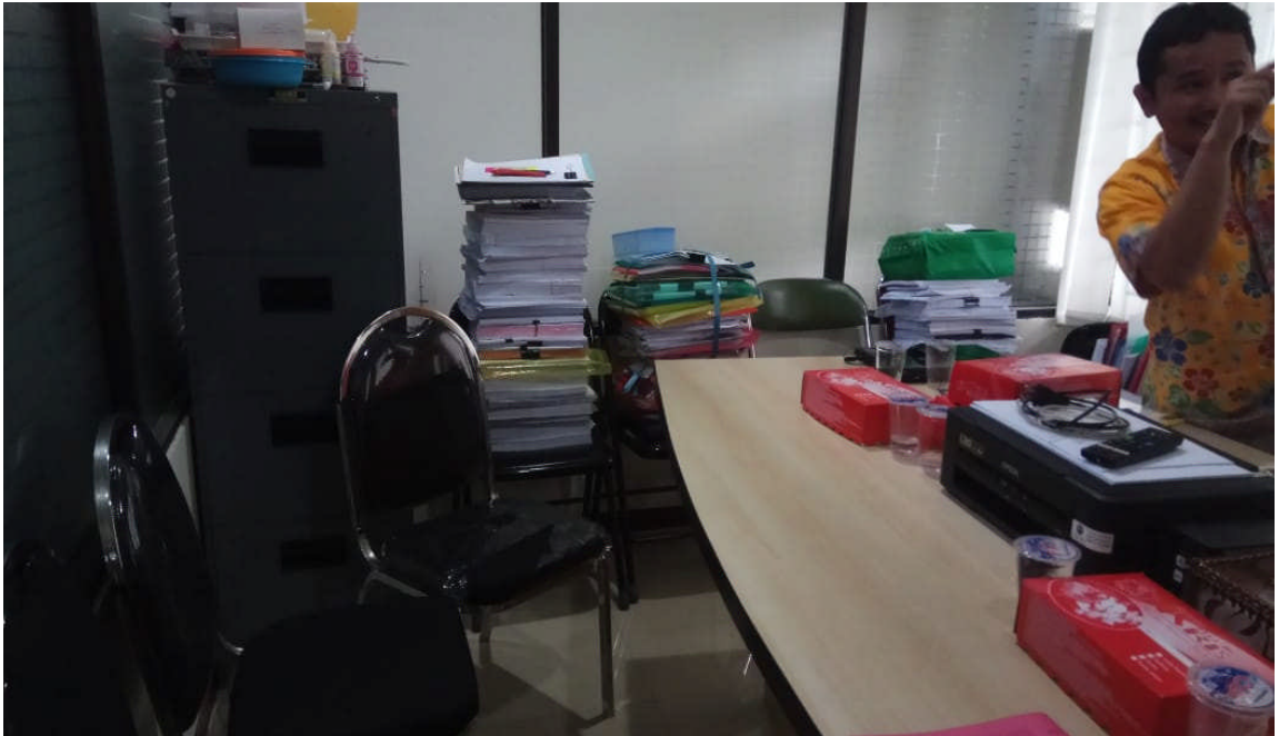
Foto 6. Sudut Ruang Staff