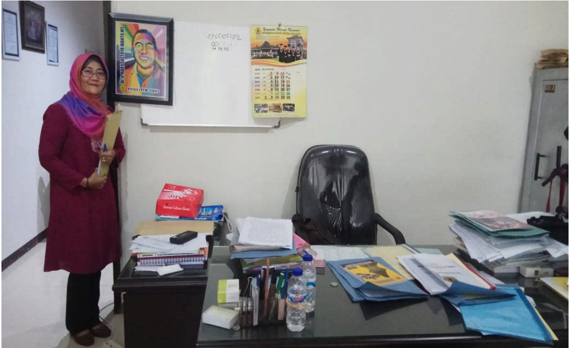
Foto 2. Ruang/Meja Ketua LPPM-UWKS Tampak Samping